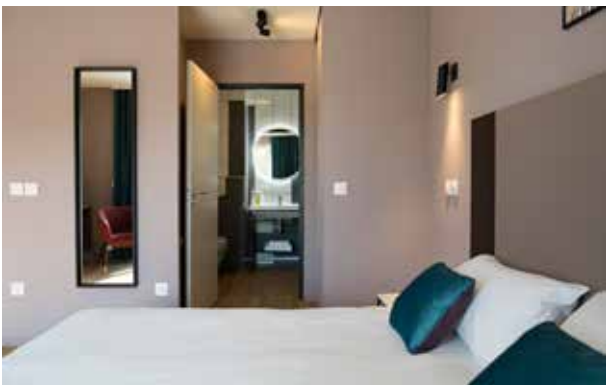
Résidence**** directement reliée à vos espaces de soins