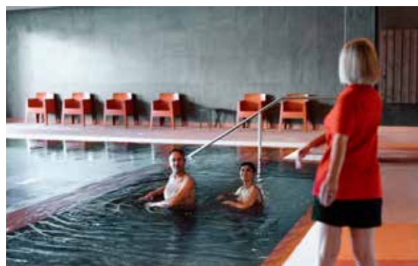
Établissement thermal premium